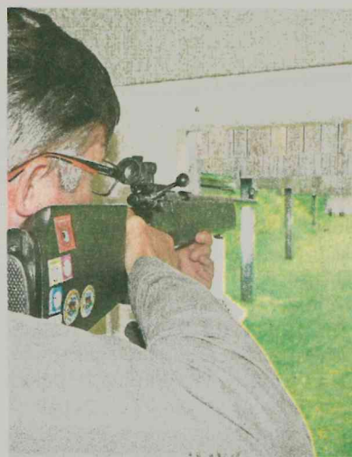
Der Schützenkönig wird mit dem Gewehr im Stehen ausgeschossen.